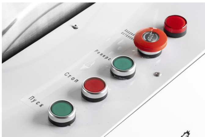
Рис.2 Панель управления